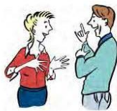
Verstehen und verstanden werden.

Ein Kind braucht Hilfe, damit es in die Schule gehen kann. Das Kind muss dann zum Beispiel einen Helfer bekommen.