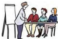
Recht auf Lernen.