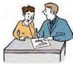
Hilfe beim Lernen.